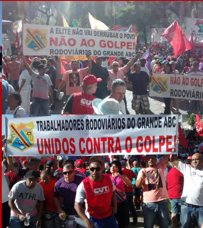
Todas estas fotos foram tiradas na manifestação do Vale do Anhangabaú no domingo, 17 de abril.

Milhares de pessoas disseram não ao absurdo e sujo golpe que está rondando o Brasil, onde um governo democrático e popular, reeleito com mais de 54 milhões de votos, sem ter feito nenhum crime previsto na Constituição, corre o risco de ser destituído.