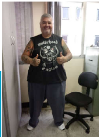
"Mixirica" depois do SPA, na sede da nossa entidade.

Nós agradecemos e exaltamos a todos pelo esforço e companheirismo. É isto aí, esta é a verdadeira união da família rodoviária do Grande ABC. Está valendo o Dia Nacional do Motorista!