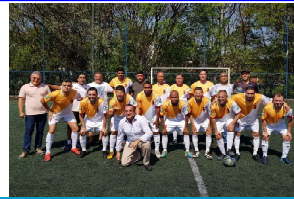
METRA - 2° LUGAR