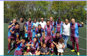
SUZANTUR - 3° LUGAR