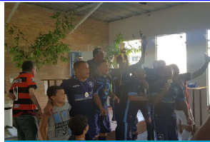
BRAZUL - 1° LUGAR

A nossa categoria marcou presença no Campeonato de Futebol realizado no Sest/Senat. A final aconteceu no sábado, 05 de outubro e o resultado está nas fotos ao lado. Parabenizamos a todos que participaram, lembrando que esporte é, acima de tudo, saúde e integração. Valeu!